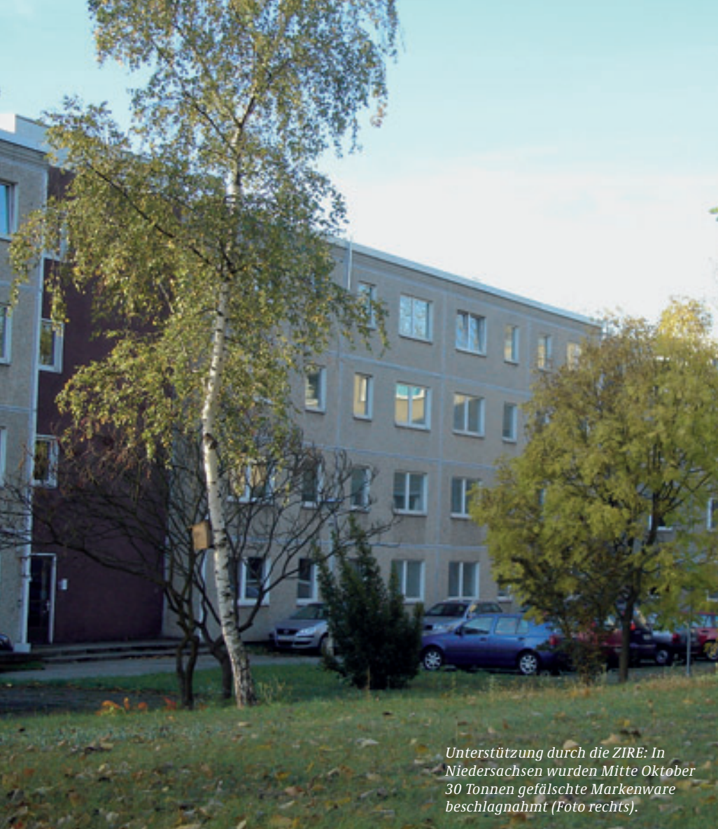
Unterstützung durch die ZIRE: In Niedersachsen wurden Mitte Oktober 30 Tonnen gefälschte Markenware beschlagnahmt (Foto rechts).